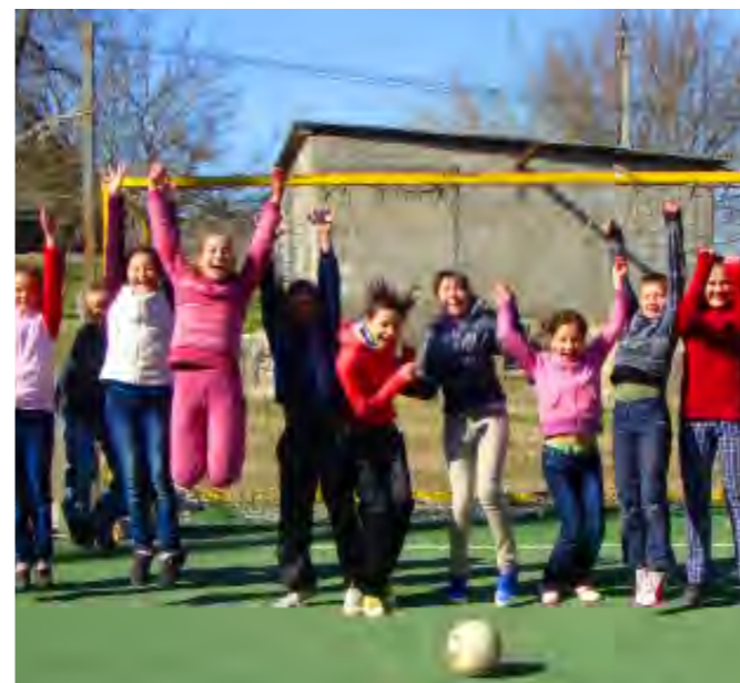
Barnen på bilden går i sjätte klass och är tolv år. Deras lärare säger, "They will be the change we all want to see in the future!"

De direkta insatserna handlar om att öka kunskapen i samhället om våldsproblemen bland barnen och samtidigt ge direkt stöd till drabbade barn genom skolans verksamhet.