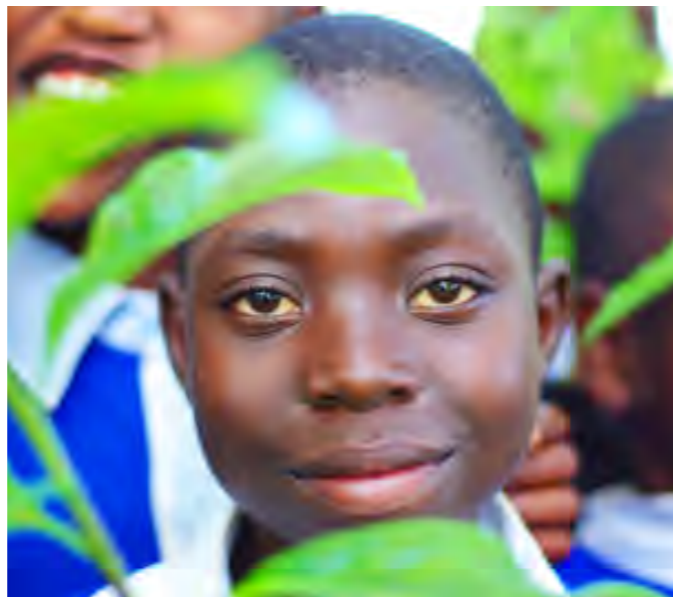
På skolgården planteras träd och ett grönsaksland ger mat till skollunchen. St. Mathew Katimba, Uganda.