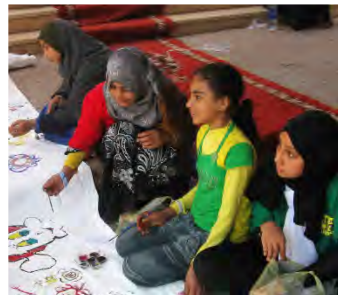
Plans stödcenter för arbetande barn i södra Kairo. Här får barnen utbildning, tillgång till hälsokliniker och juridisk hjälp samt tillgång till mat.

Barnen är framtidens bönder och genom utbildning lägger Vi-skogen grunden till en tryggad försörjning för barnen. Dessutom sprids den nya kunskapen vidare till föräldrar och syskon, släkt och vänner. Barnen får lära sig hur marken kan utnyttjas utan att tära på de känsliga ekosystemen. De gemensamma grönsaksodlingarna ger barnen ett extra mål mat om dagen eller en inkomst till skolan att använda till nödvändiga inköp.